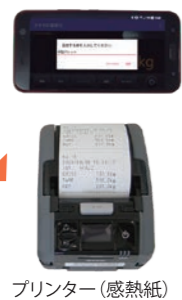
プリンター(感熱紙)