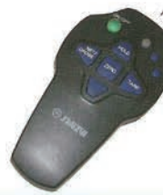
リモコン オプション