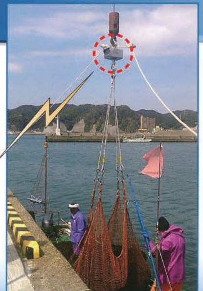
(使用現場：東安房漁協様)