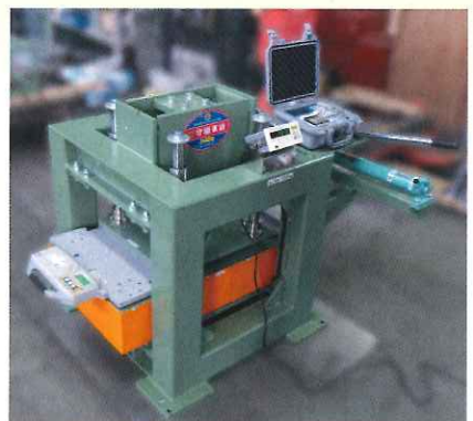
スーパー JUMBO シリーズ自社試験機

創業明暦四年 (SINCE 1658) 株式会社 守隨本店 SHUZUI SCALES CO.,LTD SINCE1658 URL : http://www.shuzui.jp/ E-Mail : hakariza@shuzui-scales.co.jp